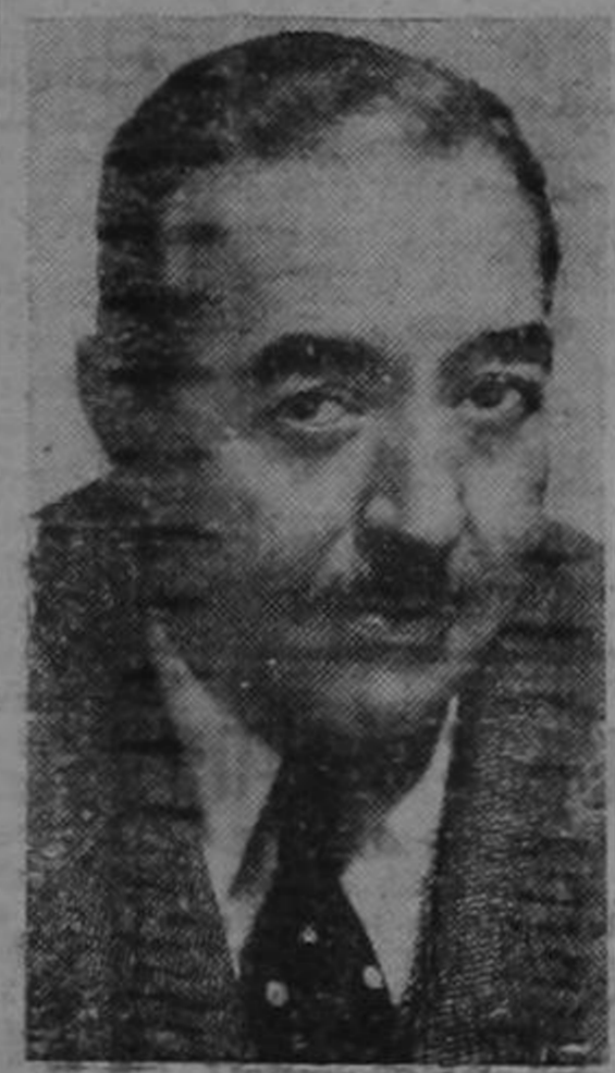
Walter Connolly, que desempeñó tan admirablemente su rol de tío holgazán del film "La Buena Tierra", se apunta un nuevo triunfo con la actuación como Jefe de Prisiones de la película Columbia: "PENITENCIARIA".

ciéndole los calcetines o lavándole la ropa al compañero? Hay muchos hombres que creen que si su mujer no prefiere estar en la cocina preparándose los platos que más les agraden, a trabajar en una oficina o un Studio, es porque ellas no les aman lo suficiente... y ¿no saben los muy tontos que las ocupaciones materiales no tienen nada que ver con las emociones? Yo supongo que Bette Davis habrá tratado de explicarle mil veces a su marido que estima mucho más su cariño que su labor ante las cámaras; pero que para acumular algún dinero para la vejez es necesario que ella trabaje... etc., pero, esto no da resultado alguno. Los hombres son radicales y quieren o toda la atención o nada. En esto demuestran que jamás dejan de ser niños, por eso hay mujeres adorables como Bette Davis que fracasan como esposas, porque no hay ninguna que pueda entregarse totalmente a un amor si lleva en su alma algo de inspiración o de fuerza creativa, y