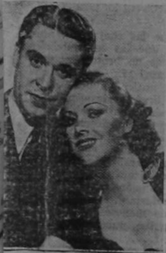
Walter Connolly y Wyn Cahoon, dos de los actores jóvenes de los protagonistas del nuevo film Columbia. "LA OSA DEL PECADO".

entre ellos y el amor salió triunfante en aquella primera alternativa tempestuosa de la vida privada de esta muchacha, que se ha ganado el estrellato exclusivamente por su talento y sus extraordinarias facultades artísticas. Hay mujeres que jamás toman a la ligera los asuntos del corazón y Bette es una de ellas; por eso cuando formalizó su compromiso con Harmon Nelson, se propuso hacer un éxito de su vida conyugal, y de sacrificio en sacrificio fué acomodando todas sus actividades a las exigencias de las de él; pero, Bette no se quejaba. Como quería muchísimo a su marido, lo hacía todo con deleite y tenía concentrado todo su empeño en que su marido encontrara la mayor dicha.